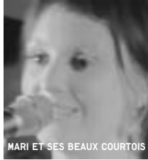
MARI ET SES BEAUX COURTOIS

Les informations contenues dans cet article sont tirées d'un document que nous a transmis Sel du Lac.